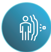
Sensor de movimento