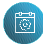
Menos chamadas de serviço de rotina